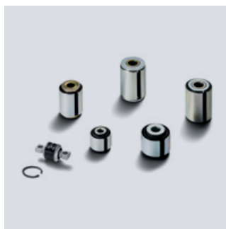
Oryginalne elementy osi MAN