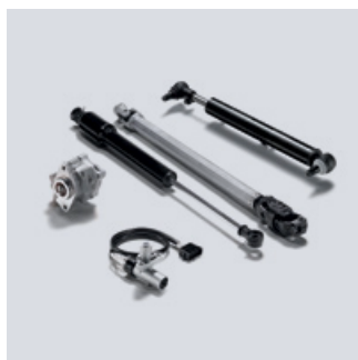
Oryginalne części układu kierowniczego MAN

Drażki kierownicze wzdłużne, poprzeczne i pompy układu kierowniczego są niezbędnymi elementami układu kierowniczego i posiadają bardzo małe zakresy tolerancji do przekazywania ruchów kierownicy na koła. Wszystkie elementy są narażone na działanie dużych sił i w niektórych przypadkach wysokie temperatury. Aby wielokrotnie wytrzymać te obciążenia i zapewnić najwyższy poziom bezpieczeństwa, jakość odgrywa ważną rolę.