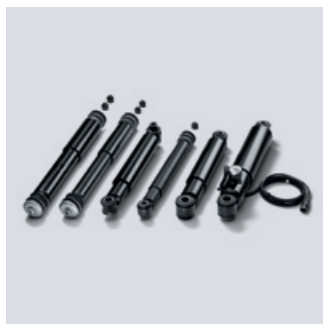
Oryginalne amortyzatory MAN

Wraz z zawieszeniem amortyzatory zapewniają stabilny kontakt kół z powierzchnią jezdnią. Utrzymują pojazd bezpiecznie na pasie ruchu, zapewniają krótką drogę hamowania i znacznie ułatwiają panowanie nad pojazdem.