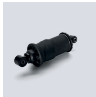
Oryginalne resory pneumatyczne MAN