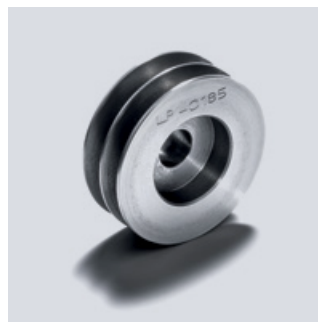
Oryginalne koła pasowe MAN