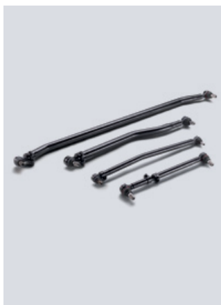
Oryginalne drażki wzdłużne i poprzeczne MAN