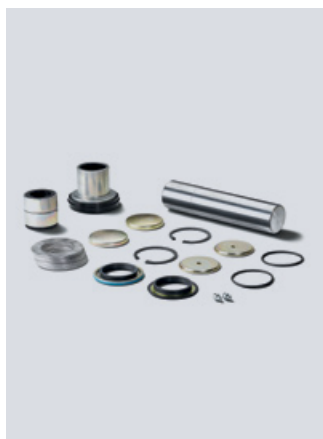
Oryginalny zestaw naprawczy zwrotnicy MAN