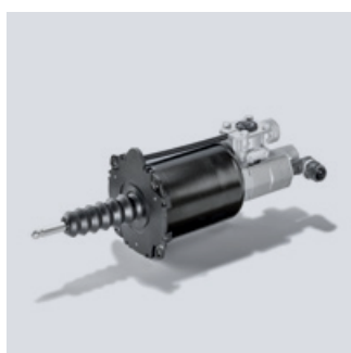
Oryginalny wzmacniacz sprzęgła MAN