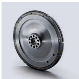
Oryginalne koła zamachowe MAN

Sprzęgło jest jednym z najbardziej obciążonych elementów układu napędowego. Nawet po wielu tysiącach operacji wysprzęglania, musi nadal działać niezawodnie. Możesz polegać na jakości i długiej żywotności naszych oryginalnych sprzęgieł MAN, ponieważ zapewniają komfortową jazdę i wytrzymują nawet ekstremalne warunki.